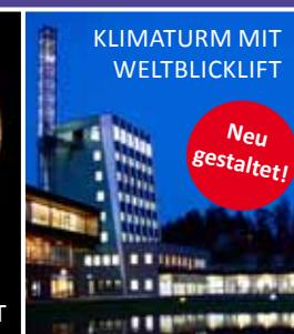
KLIMATURM MIT WELTBlickLIFF