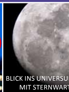
BLICK INS UNIVERSUM MIT STERNWARTE